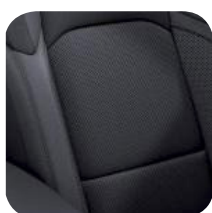
TAPICERKA MATERIAŁOWA BLACK SPORT