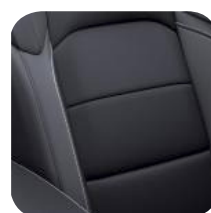
TAPICERKA SKÓRZANA BLACK