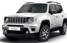
296 Biały Alpine (pastelowy)