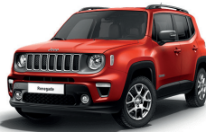
176 Czerwony Colorado (pastelowy)