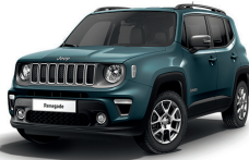
435 Niebieski Shade (metalizowany)