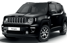
601 Czarny Solid (pastelowy)