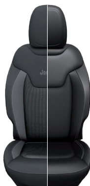
Tapicerka materiałowa / skórzana