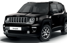
679 Grafitowy Graphite (metalizowany)